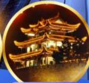
หอคอยทองคำเทียนจิน