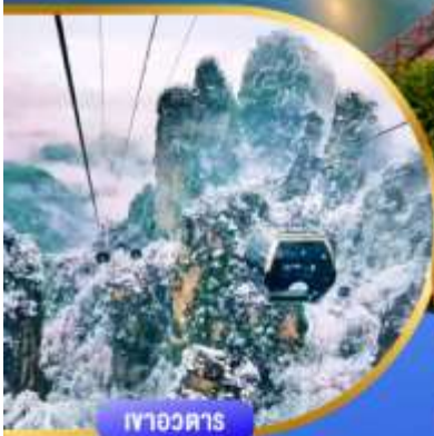
เทาอวดตาร