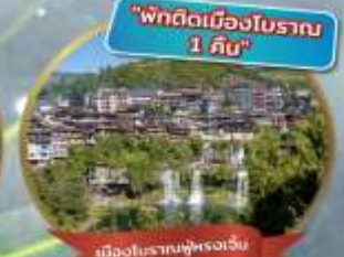
"พักติดเมืองโบราณ 1 คืน"