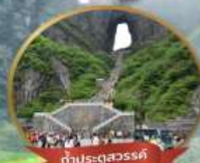
กำประตูลึกลับ