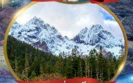
ภูเขาสีดรุณี