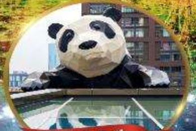
แพนด้ายักษ์

มหัศจรรย์ความงาม อุทยานจิวจ้ายโกว (รวมรถเหมาเที่ยวอุทยานเต็มวัน) ชมอุทยานหวงหลง (รวมกระเช้า) • สีดรุณี • อุทยานชวงเจียวโกว (รวมรถอุทยาน) เมืองเก่าชงพาน • ถนนคนเดินจินหลี่ • ไท่ตุหลี่ • ชมแพนด้ายักษ์ป็นตึก