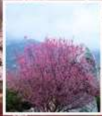
ชมดอกท้อภูเขาไถ่ซาบ