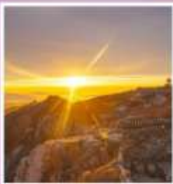
ยอดเขาอวิ๋ฮวาง