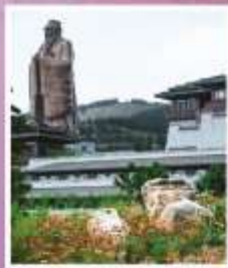
รูปปั้นขงจื้อ ที่ใหญ่ที่สุดในโลก