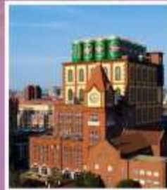
โรงงานเบียร์ซิงเต่า