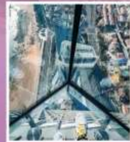
QINGDAO HAITIAN CENTER