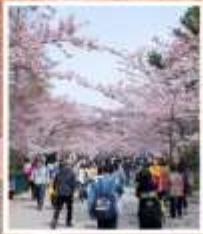
ซากุระจงซาบ