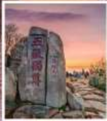
หินแกะสลักในสมัย ราชวงศ์ถัง