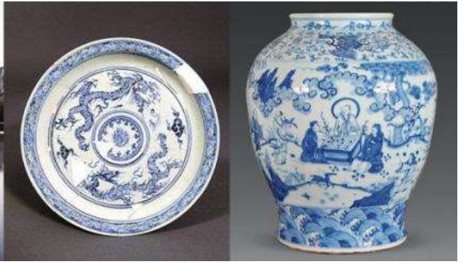
เตาเผาเครื่องลายครามจีนโบราณ

หลังอาหารนำท่านชม เตาเผาเครื่องลายครามจีนโบราณ 景德镇官窑 เป็นโรงงานผลิตเครื่องลายครามจีนโบราณที่ผลิตเครื่องใช้ต่าง ๆ (เครื่องลายคราม) อาทิ แจกันประดับบ้าน ถ้วยชาม บรรจุภัณฑ์ที่ใช้ในบ้าน เพื่อส่งถวายให้เป็นเครื่องใช้ในวังสำหรับจักรพรรดิ และพระบรมวงศานุวงศ์ เครื่องลายครามที่ผลิตจากโรงงานแห่งนี้ได้ชื่อว่าเป็นเครื่องลายครามที่ดีที่สุดในพื้นที่จีน ซึ่งของที่ผลิตได้ทุกชิ้นหลังผ่านการคัดกรองแล้วจะถูกส่งไปในพระราชวังที่กรุงปักกิ่ง ส่วนที่เหลือจากการคัดกรองจะถูกทุบให้แตกและนำมาเผาใหม่ โดยไม่สามารถนำไปขายให้กับสามัญชนทั่วไปได้.....นำท่านชมเตาเผาโบราณ และเครื่องลายครามโบราณรุ่นต่าง ๆ ซึ่งบางส่วนยังคงถูกเก็บรักษาไว้เป็นอย่างดี