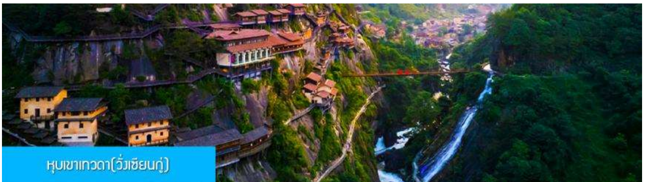
หุบเขาเทวดา(ว่างเจียนกู่)

หลังอาหารนำท่านเดินทางสู่เมือง ชั่งเหลา 上饶 (ระยะทาง 127 กม. ใช้เวลาเดินทางโดยรถบัสราว 2 ชั่วโมง)