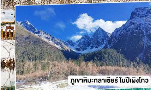
ภูเขาหิมะกลางเซียร์ ในปีเฉิงโกว