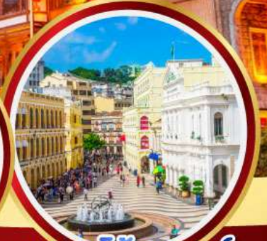
เซนาโดสแควร์