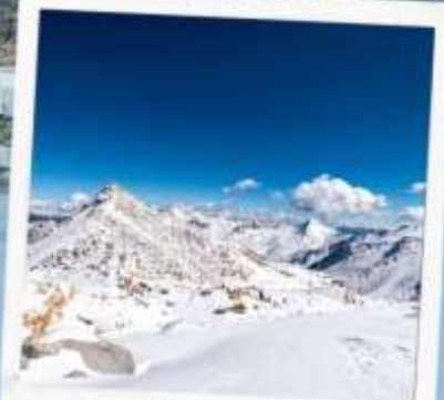
ภูเขาหิมะการ์เซีย ท่ากู่ปิงชวน