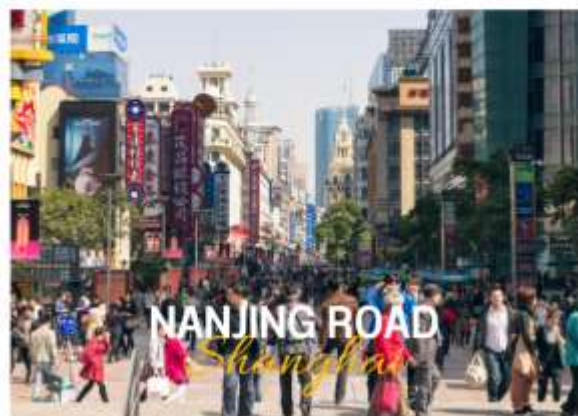
NANJING ROAD Shanghai

ถนนหนานจิง หรือที่รู้จักกันอีกชื่อว่า นานกิง ย่านช้อปปิ้งที่เก่าแก่และมีชื่อเสียงที่สุดในเซี่ยงไฮ้เลยในตอนเย็นจะเป็นช่วงที่ร้านค้าและบาร์ต่างๆกำลังคึกคักมีนักดนตรีริมถนนเต็มไปด้วยแสงสีเสียงเหมาะกับการเดินเล่นหรือนั่งรถรางชมบรรยากาศรอบๆฝั่งตะวันตกจะมีห้างสรรพสินค้าใหญ่ๆสลับกับร้านแบบจีนดั้งเดิมอยู่ตลอดสองข้างทาง