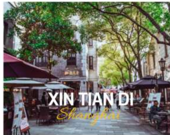
XIN TIAN DI Shanghai

ย่านใหม่ใจกลางเมืองเซี่ยงไฮ้ อีก 1 ย่านช้อปปิ้งและร้านอาหาร ร้านอาหาร ที่มีเอกลักษณ์ จากสถาปัตยกรรมที่ใช้อิฐบล็อกแบบสถาปัตยกรรมชิคเก๋มึน ซึ่งเป็นการผสมผสานกันระหว่างสถาปัตยกรรมจีนกับตะวันตกเข้าด้วยกัน ท่านจะพบกับทางเดินหิน กำแพงหิน ประติมากรรม ที่มีเอกลักษณ์ โดย 2 ทางของถนนมีต้นเมเปิ้ลตลอดทาง ยิ่งทำให้ย่านนี้มีเสน่ห์เพิ่มเป็นเท่าตัว