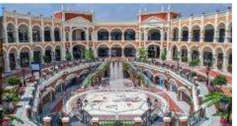
Florentia Village Outlet

*ทางบริษัทฯ ขอสงวนสิทธิ์ในการสลับโปรแกรมทัวร์ตามความเหมาะสมขึ้นอยู่กับสถานการณ์หน้างาน โดยค่านี้จึงแสดงผลประโยชน์ของลูกค้าเป็นหลัก