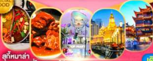
สุกัหมาล่า