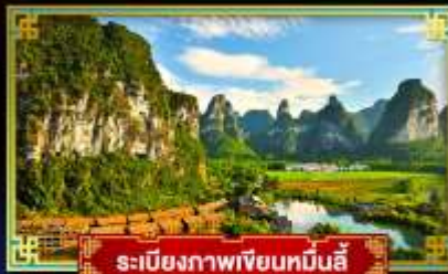
ระเบียบภาพเขียนหมินอี