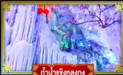
ตำนานแห่งหลงกง

"เที่ยว 2 มณฑล กวางซี-กัซโจว" สุดอลังการ น้ำตก 2 พรมแดน แหล่งท่องเที่ยวระดับ 5A