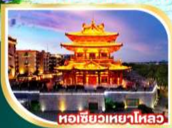
หอชิวเหยาไหลว