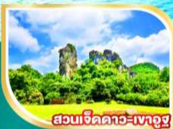
สวนเจ็ดดาว-เงาอู๋