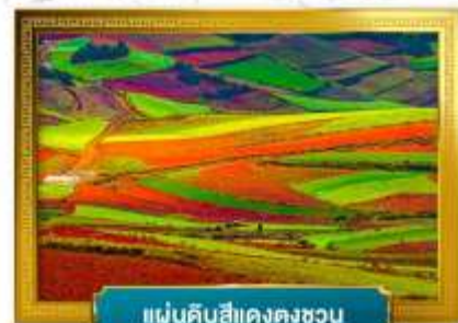
แผ่นดินสีแดงตงชวน