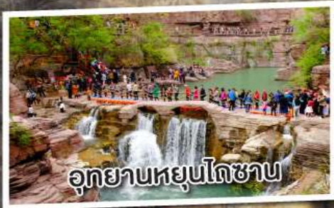
อุทยานหยุนโกซาน