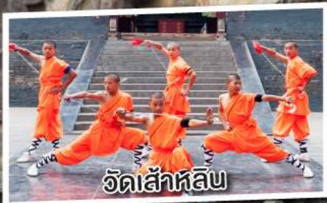
วัดเส้าหลิน