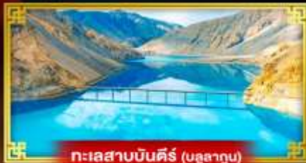
ทะเลสาบบินคิ่ร์ (บลูลาคุน)