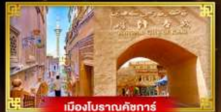
เมืองโบราณคัชการ์