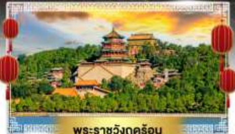
พระราชวังคุรุอัน