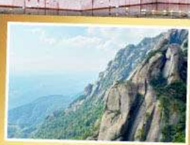
เขาหลงซาน