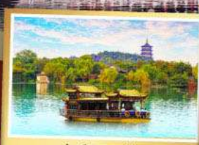
ล่องเรือทะเลสาปซีหู