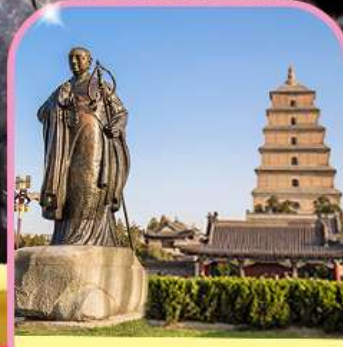
เวดีย์ห่านป่าใหญ่