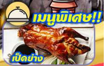
เมนูพิเศษ!! เป็ดย่าง