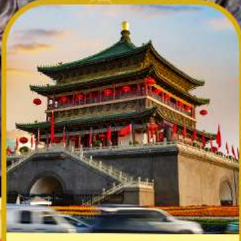
จัตุรัสหอกลอง หอระฆัง