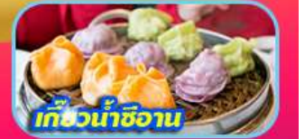
เกี๊ยวซ่าจีน