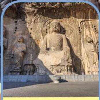
ถ้ำแกะสลักพาสินหลงเหมิน