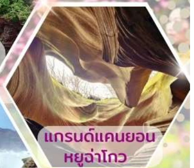
แกรนด์แคนยอนหยูจ่าโกว