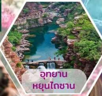
อุทยานหยุนโตซาน