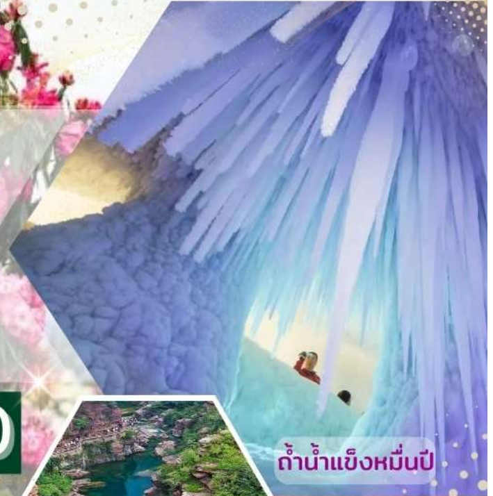
กำน้ำแข็งหมื่นปี