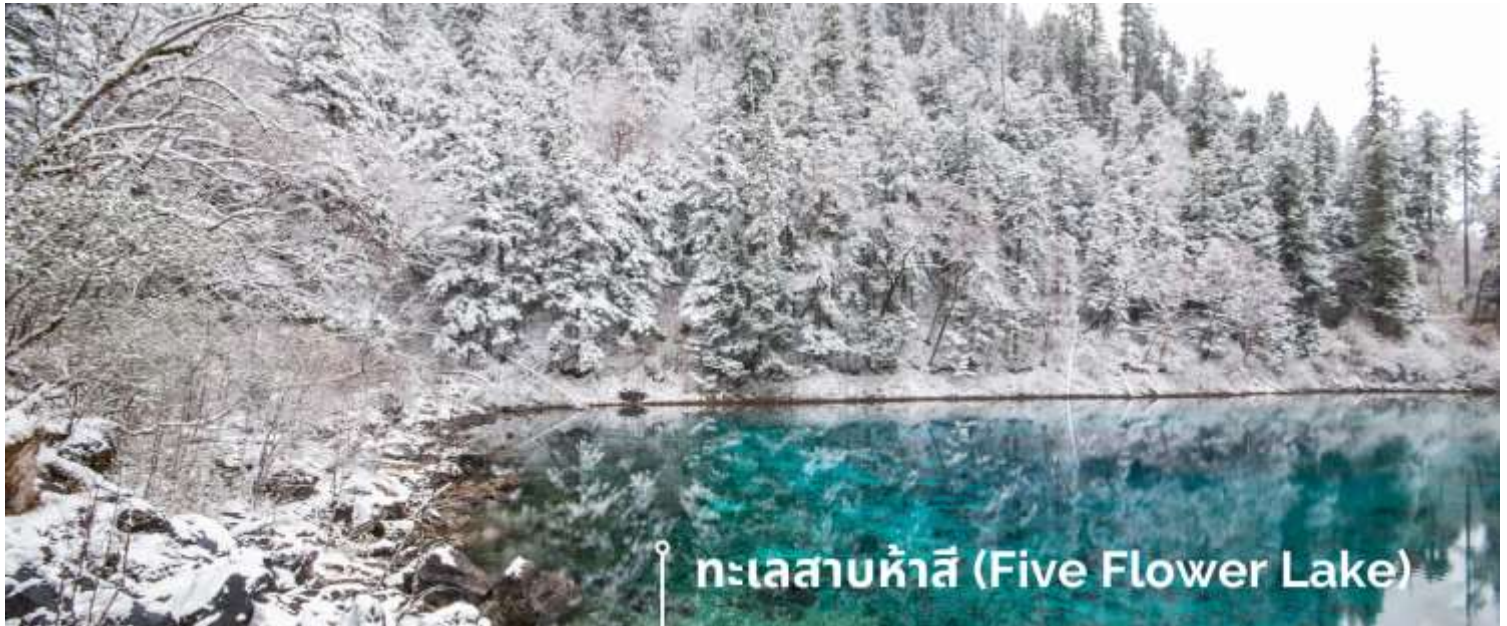
ทะเลสาบห้าสี (Five Flower Lake)

หนึ่งในจุดที่สวยงามและนักท่องเที่ยวแห่มาเยี่ยมชมเยอะที่สุด ตั้งอยู่ที่ความสูงเหนือระดับน้ำทะเลประมาณ 2,472 เมตร น้ำลึกประมาณ 5 เมตร น้ำใสจนเห็นพื้นด้านล่างของทะเลสาบ สีของผิวน้ำสวยงามแปลกตา โดยเฉพาะเมื่อยามแสงอาทิตย์สาดส่องกระทบผิวน้ำ สีของน้ำในทะเลสาบจะสะท้อนเป็นสีส้มถึง 5 เฉดสี สวยงามสะกดตา ซึ่งสาเหตุที่ทำให้เกิดสีสันต่างๆ นี้มาจากการสะสมของแร่ธาตุ และพืชน้ำชนิดต่างๆ โดยจะมีสีสันแตกต่างกันไปตามฤดูกาลและ