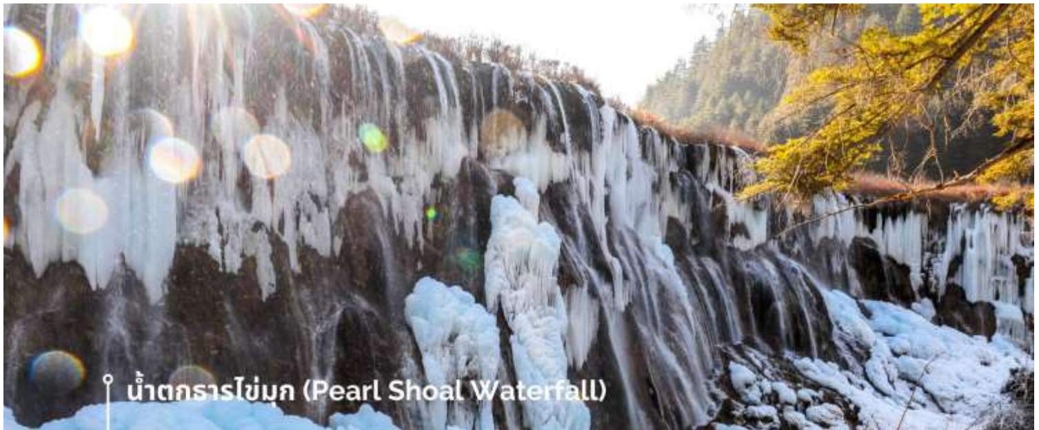
น้ำตกธารไข่มุก (Pearl Shoal Waterfall)

หรือ น้ำตกบูริออลาง (Nuo Ri Lang Waterfall) ถือเป็นน้ำตกที่ใหญ่ที่สุดในจิวจ้ายโกว มีความสูง 40 เมตร กว้าง 310