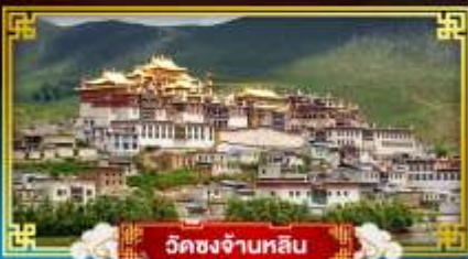
วัดชงจ้านหลิน