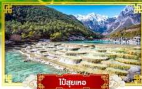
ไป๋สือเหอ