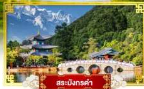
สระมังกรดำ