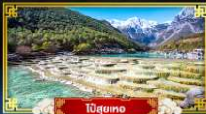
ปี่สุยเทอ