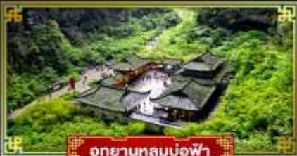
อุทยานหลุมฟ้า

"ฉงชิ่ง" มหานครสุดอลัง เมืองมรดกโลก อุทยานแห่งชาติหลุมฟ้า 3 สะพานสวรรค์