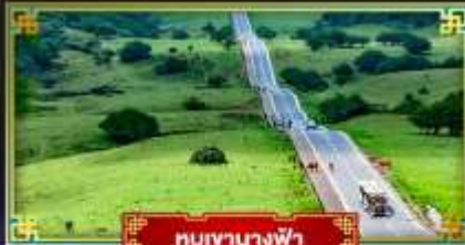
หุบเขานางฟ้า