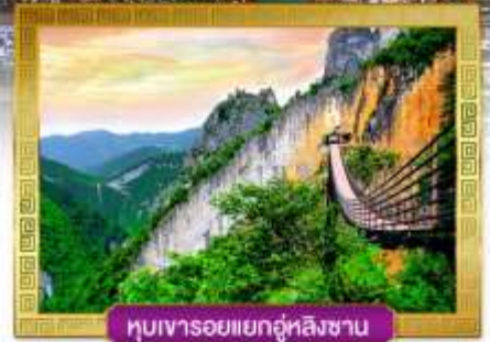
หุบเขารอยแยกอู่หลิงซาน