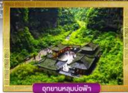
อุทยานหลุมบ่อฟ้า