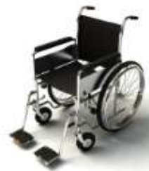
การรับการดูแลเป็นพิเศษ

กรณีผู้เดินทางต้องการความช่วยเหลือเป็นพิเศษ อาทิเช่น การใช้วีลแชร์ กรุณาแจ้งบริษัทฯ อย่างน้อย 7 วันก่อนการเดินทาง มิฉะนั้นบริษัทฯ จะไม่สามารถจัดการล่วงหน้าได้ เนื่องจากการขอวีลแชร์ในสนามบินนั้น ต้องมีขั้นตอนในการขอล่วงหน้า และบางสายการบินอาจมีการเรียกเก็บค่าใช้จ่ายทั้งทางสนามบินในไทยและในต่างประเทศ ซึ่งผู้เดินทางสามารถสอบถามกับเจ้าหน้าที่ได้โดยตรงก่อนทำการจอง และหากในคณะของท่านมีผู้ต้องการดูแลพิเศษ เช่น ผู้ที่นั่งรถเข็น (Wheelchair), เด็ก, ผู้สูงอายุและผู้ที่มีโรคประจำตัวหรือไม่สะดวกในการเดินทางท่องเที่ยวในระยะเวลาเกินกว่า 4 - 5 ชั่วโมงติดต่อกัน ท่านและครอบครัวต้องให้การดูแลสมาชิกภายในครอบครัวของตนเอง เนื่องจากการเดินทางเป็นหมู่คณะ หัวหน้าทัวร์มีความจำเป็นต้องดูแลคณะทัวร์ทั้งหมด