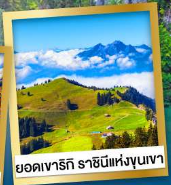
ยอดเขารักิ ราชนีแห่งขุนเขา