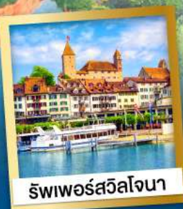
ริวีเอรสวิสเซอร์แลนด์