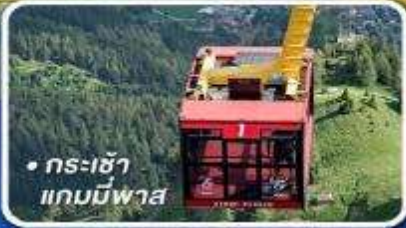
• กระเช้า แกมมีพาส