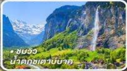
• ชมวิว น้ำตกชเวาบบาค

กับรถไฟด่วนขบวนสวรรค์ เซอร์แมท-อันเดอร์แมท