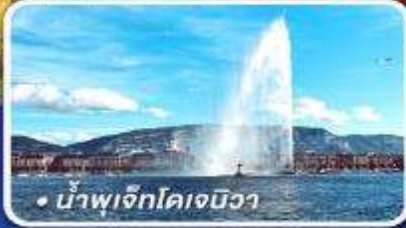
• น้ำพุเจ็ทโคเจนิวา

นั่งรถไฟด่วนกราชียเอ็กซ์เพรสระดับเฟิร์สคลาส ขึ้น 4 เหน่าดังแห่งสวิส อาบน้ำแร่พักในเมืองลูเกอร์บาด