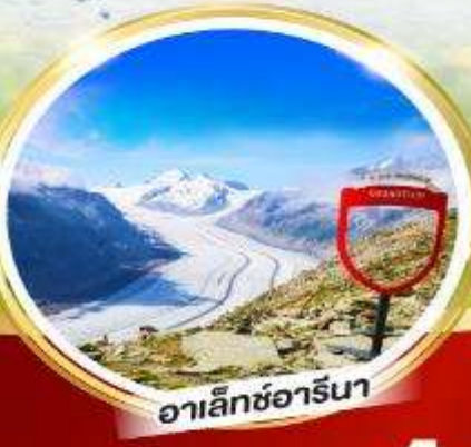
อาเล็กซารีนา