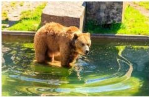
บ่อหมีสีน้ำตาล

เมืองหลวงของประเทศสวิตเซอร์แลนด์ เมืองโบราณเก่าแก่สร้างขึ้นเมื่อ 800 ปีที่แล้ว โดยมีแม่น้ำอาเร่ (Aare) ล้อมรอบตัวเมือง เสมือนเป็นป้อมปราการทางธรรมชาติไว้ 3 ด้าน นำท่านเที่ยวชมสถานที่สำคัญต่างๆในกรุงเบิร์น กรุงเบิร์นได้รับการยกย่องจากองค์การยูเนสโกให้เป็นเมืองมรดกโลก ในปี ค.ศ. 1863 นอกจากนี้เบิร์นยังถูกจัดอันดับอยู่ใน 1 ใน 10 ของเมืองที่มีคุณภาพชีวิตที่ดีที่สุดในโลก ในปี ค.ศ. 2010