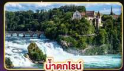
น้ำตกไรน์