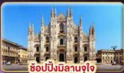
ช้อปปิ้งมิลานจุใจ

ที่สุดของธรรมชาติ แห่ง "ยุโรป" แช่น้ำแร่ วิวดอกสัณฐาน