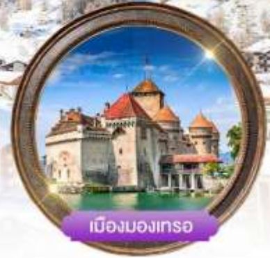
เมืองมงเทรซ