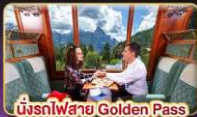
นั่งรถไฟสาย Golden Pass