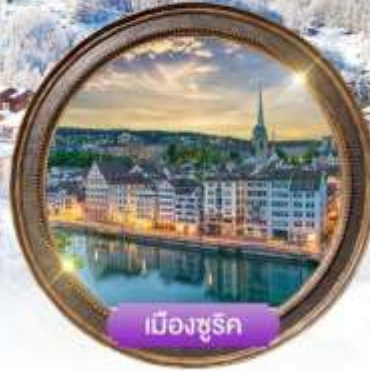
เมืองซูริก