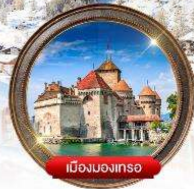
เมืองมอเทอ