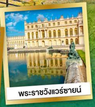
พระราชวังแวร์ซายน์