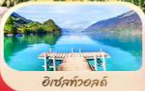
อีเซลท์วอลด์