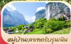
หมู่บ้านเลาเทอร์บรุนเนน