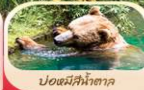
ป้อมหมีสีน้ำตาล