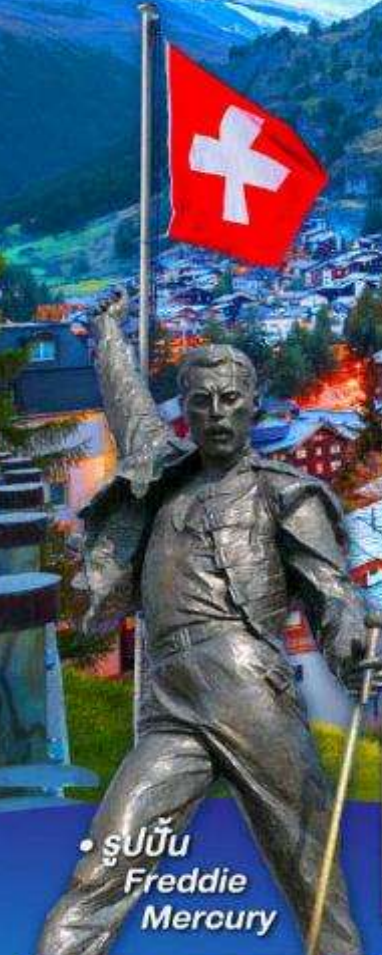
• รูปปั้น Freddie Mercury

พีชิต 5 เวกริก, เวกฮาร์ดเคอร์คุม, เวกจุงเฟรรา เวกกลาซีเยร์ 3000 และ เวกกรอนเนือร์แกรต