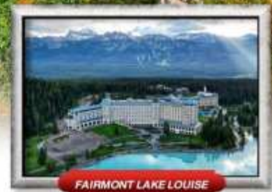
FAIRMONT LAKE LOUISE

บินทรู สายการบิน Full Service | เมนูพิเศษ! แคนาดาเคียนลิออนสแควร์