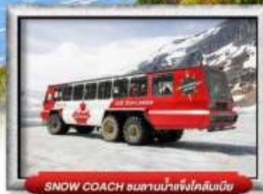
SNOW COACH ขนานน้ำแข็งใกล้หิมะ