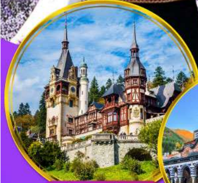
ปราสาทเปเลส