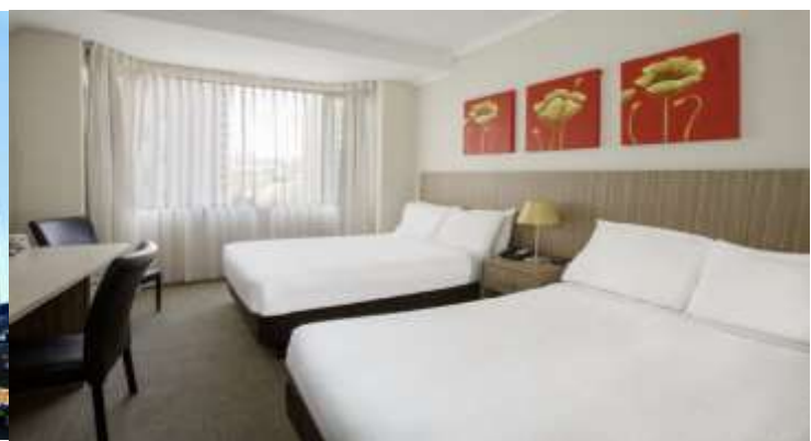
(โรงแรมย่านใจกลางเมือง ใกล้แหล่งช้อปปิ้ง เดินทางสะดวก)