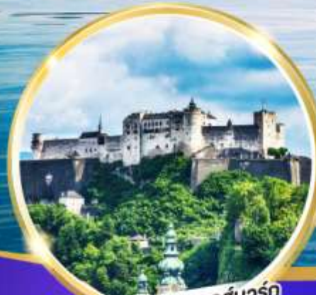
ปราสาทโฮเฮนซอลส์บวร์ก