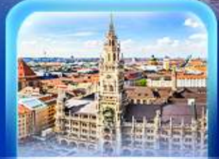
จัตุรัสมาเรียนพลาทซ์

เวียนนา ปราสาทนอยชวาสไตน์ ลูเซิร์น เซอร์แมท ชุก ซูริก