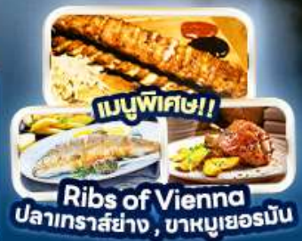
เมนูพิเศษ!! Ribs of Vienna ปลาเทราสย่าง, บาหมูเยอร์มัน