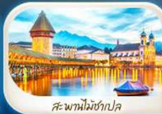
สะพานไมซ์ชาเปล