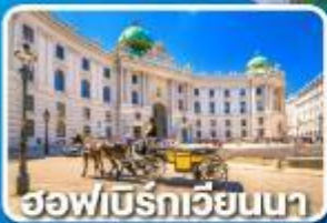
ฮอฟเบิร์กเวียนนา