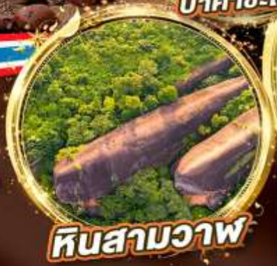
หินสามวาฬ