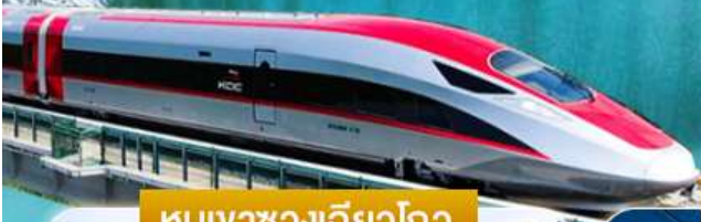
หุบเขาของเอียวโกว