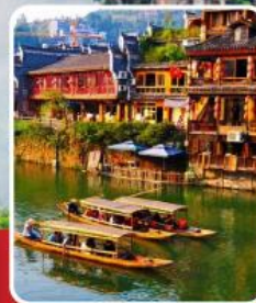
เมืองโบราณฟ่งหวง

เที่ยวฟิน 2 เมืองโบราณ พิชิตเขาวงกต แพนดอร่าของเมืองจีน