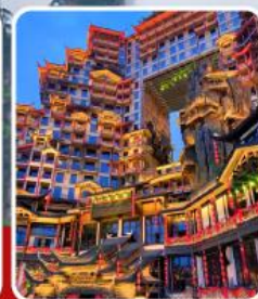
ตึก 72 ชั้น

อุทยานฉางเจียเจีย เขาเทียนจื่อซาน สะพานหนึ่งในใต้หล้า ทะเลสาบเป่าเฟิงหู ตึกมหัศจรรย์ 72 ชั้น เมืองโบราณฟูหลงเจิน เมืองโบราณฟ่งหวง ล่องเรือแม่น้ำถิวเจียง สะพานสายรุ้ง ซ้อปี้ง ถนนคนเดินหวงซิงอู่