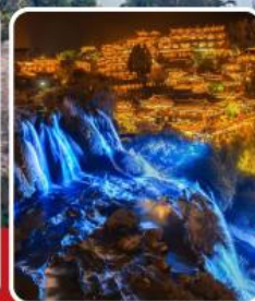
ฟูหลงเจิน