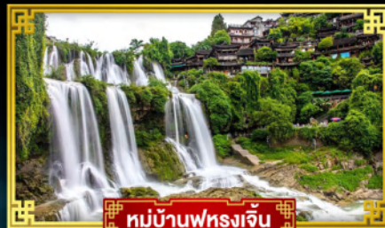
หมู่บ้านฟู่หลงเจิน