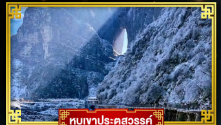
อุทยานประตูสวรรค์