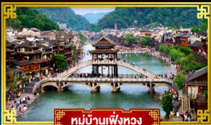
หมู่บ้านเฟิ่งหวง

สุดคุ้ม!! พักหรู 5 ดาว ทุกคืน เที่ยว 2 เมืองโบราณแดนมังกร