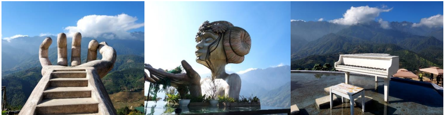
ที่พัก SAPA HOTEL 3* หรือเทียบเท่ามาตรฐาน ซาปาเวียดนาม

เที่ยง รับประทานอาหาร ณ กั๊ดตาดคาร นำท่านเช็กอิน Moana sapa Café แลนด์มาร์คแห่งใหม่ของเมืองซาปา ให้ท่านอิสระเลือกซื้อเครื่องดื่ม และเพลิดเพลินกับสายหมอกจางๆ พร้อมกับบรรยากาศสดชื่น อิสระให้ถ่ายภาพตามอัธยาศัย จากนั้นนำท่านอิสระช้อปปิ้งที่ ตลาด Love Market มีสินค้าให้ท่านเลือกช้อปปิ้งมากมาย ไม่ว่าจะเป็นสินค้าพื้นเมือง ของฝาก ขนม กระเป๋า รองเท้า ท่านสามารถช้อปปิ้งอย่างจุใจ