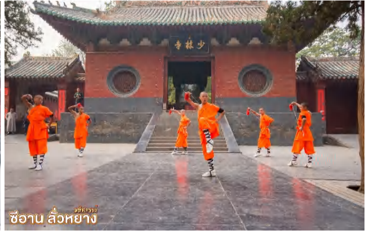
ซืออาบ ลิ้วหย่าง

เยือน อุทยานป่าเจดีย์ “ถ้ำหลิน” (รวมรถอุทยาน) มีเจดีย์กว่า 200 องค์ ที่มีความเก่าแก่มากกว่า 1,500 ปี เป็นสุสานอดีตของเจ้าอาวาสและหลวงจีนมาตั้งแต่ยุคสมัยของราชวงศ์ถัง