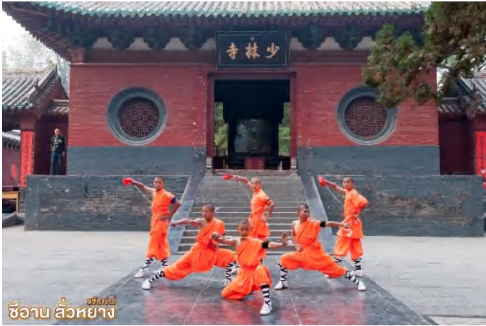
ซืออาบ ลิ้วหย่าง