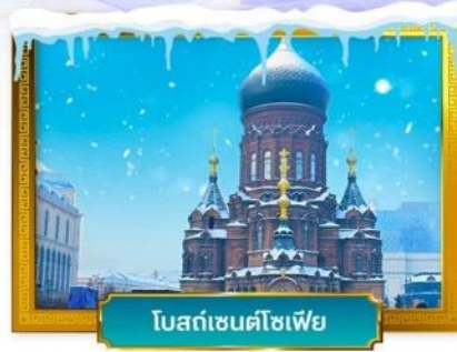
โบสถ์เซนต์ไอแซค