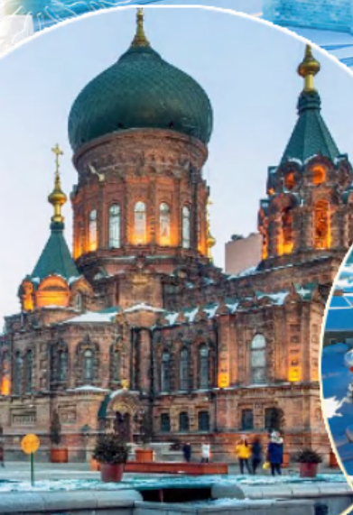
โบสถ์เซนต์ไอแซค

เข้าชมงานสุดยิ่งใหญ่ Harbin Ice & Snow Festival