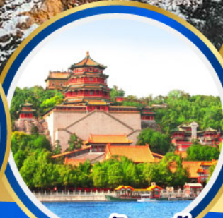
พระราชวังฤดูร้อน อ้อหอยวน