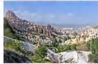
หมู่บ้านของนกพิราบ