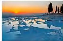
ปามุคคาเล่

** พักที่ RICHMOND THERMAL HOTEL 5* หรือเทียบเท่า **