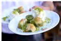
ชิมไอศกรีมตุรกีต้นกำเนิด Nemrut Mountain