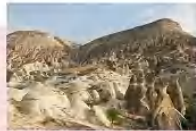
หุบเขาเดเฟเนซท์

** พักที่ DEDELI CAVE HOTEL 5* หรือเทียบเท่า **