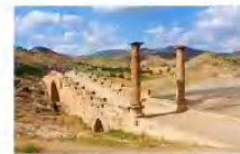
สะพานเซเวอร์ริน

19.20 น. เห็นฟ้าสู่กรุงอิสตันบูล โดยเที่ยวบิน TK 2215