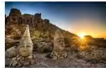
ชมพระอาทิตย์ขึ้น